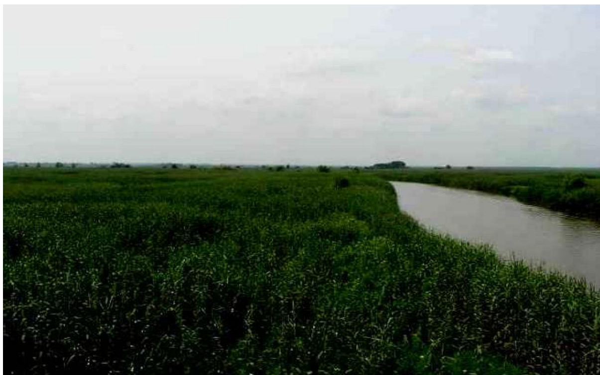
تصاویری زیبا از تالاب سرخانگل