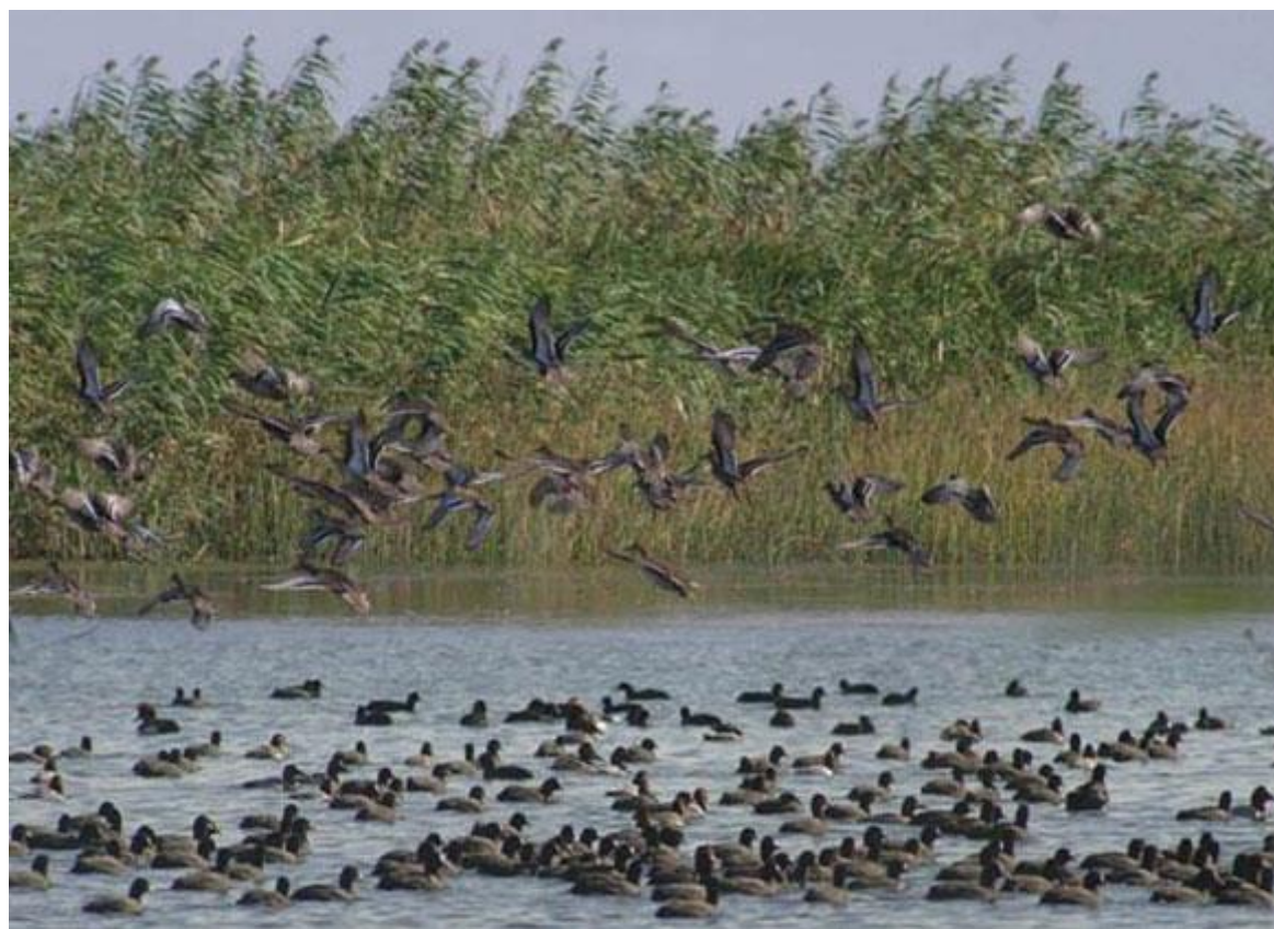
تصاویری زیبا از تالاب امیرکلیه